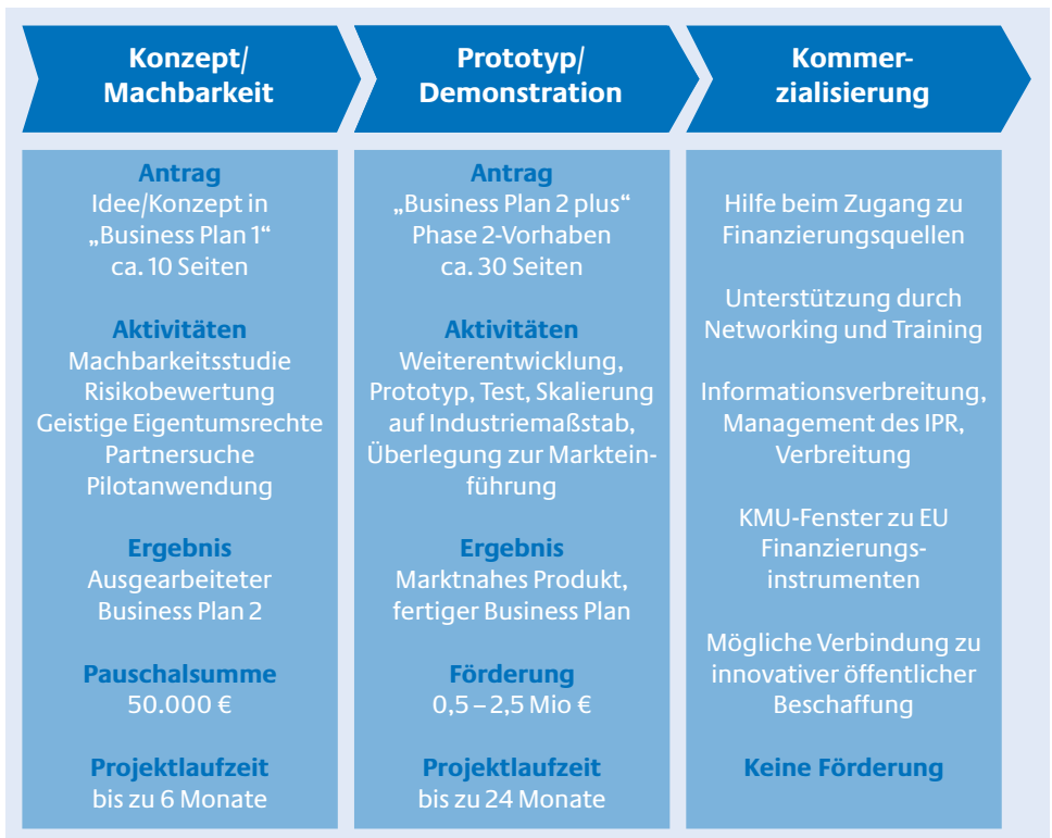
Abb. 2: Die drei Phasen des KMU Investments

Es besteht die Möglichkeit zu Verbund- oder Einzelförderung. Antragsberechtigt sind ausschließlich gewinnorientierte KMU.